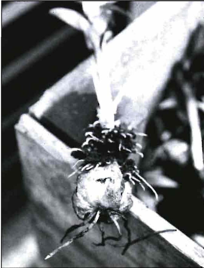
Un bulbo en vía de crecimiento, mostrando sus raíces basales y del tallo.

Los llamados «bulbos de doble cabeza», son destinados a ser cultivados en un invernadero como plantas de «maceta». Los bulbos muy deteriorados por el proceso de mecanización, suelen ser eliminados para evitar «pudriciones» durante el almacenamiento.