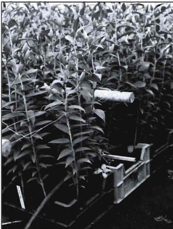
Cultivo en cajas en invernadero en A. Bakker & Z.