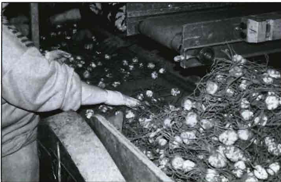
Arriba, bulbo de Lilium de doble raíz. En la otra fotografía, línea de clasificación en el almacén de Hoff Quality First

L os bulbos de Lilium requieren al menos entre 6-7 semanas a una temperatura entre 0 y 2°C, para su adecuada preparación. En algunos establecimientos especializados se suele dar una semana más para asegurarse la debida preparación.